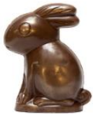
REF 70.06 RÊVEUR · DROMER 10 cm h.