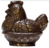
REF 70.08 KIP · POULE 12 cm h.