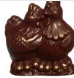
REF 70.05 2 KIPPEN VRIENDINNETJE 2 COPINES POULES 9 cm h.