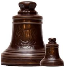
REF 70.16 - 70.10 KLOK · CLOCHE 9/20 cm h.